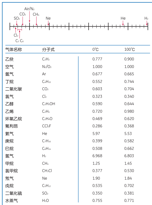
各种气体在0°C和100°C时的相对热导率

对于氮气中90 ~ 100% H 2 的测量，四端口型XMTC使用流动参比气体可满足该应用。对于标定，零点用氮气中含90% H 2 作为标气，满量程用100% H 2 。